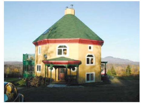
L'Octogonale, l'un des sept modèles offerts par la compagnie maison vive.